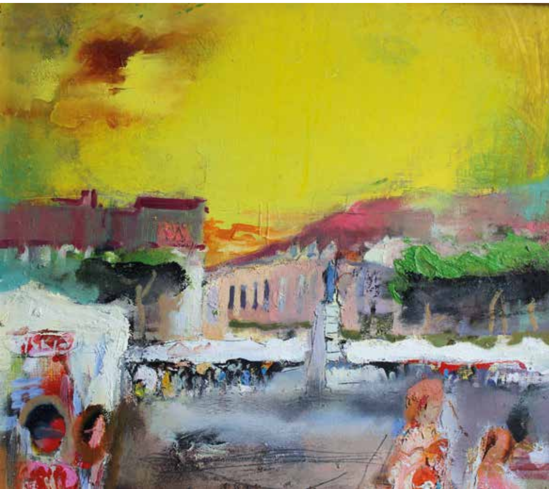
Praca z Międzynarodowych Warsztatów Artystycznych „W Kręgu Pogranicza” Łańcut- Jablonka 2013.