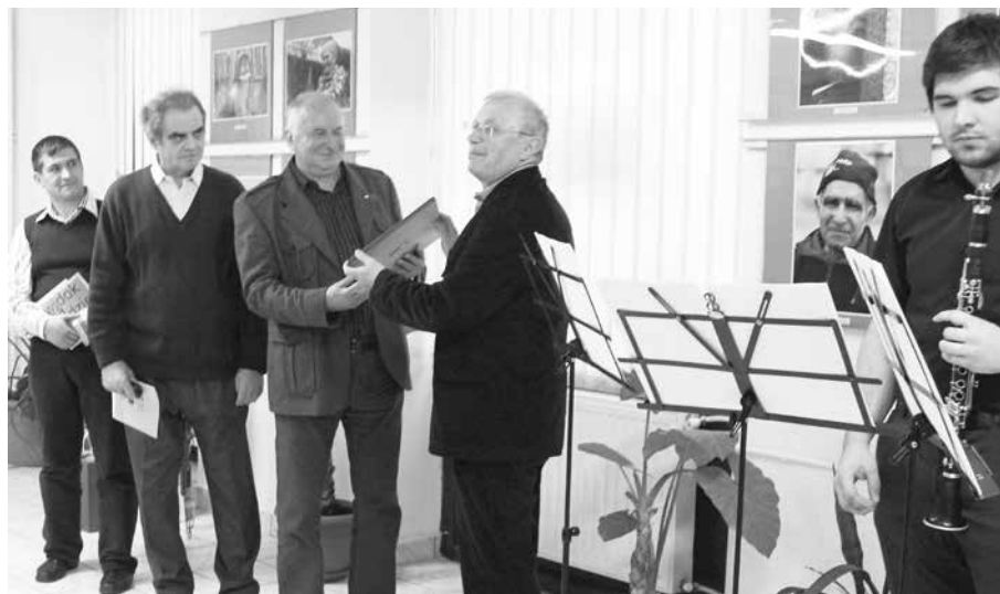
fol. A Świerczek