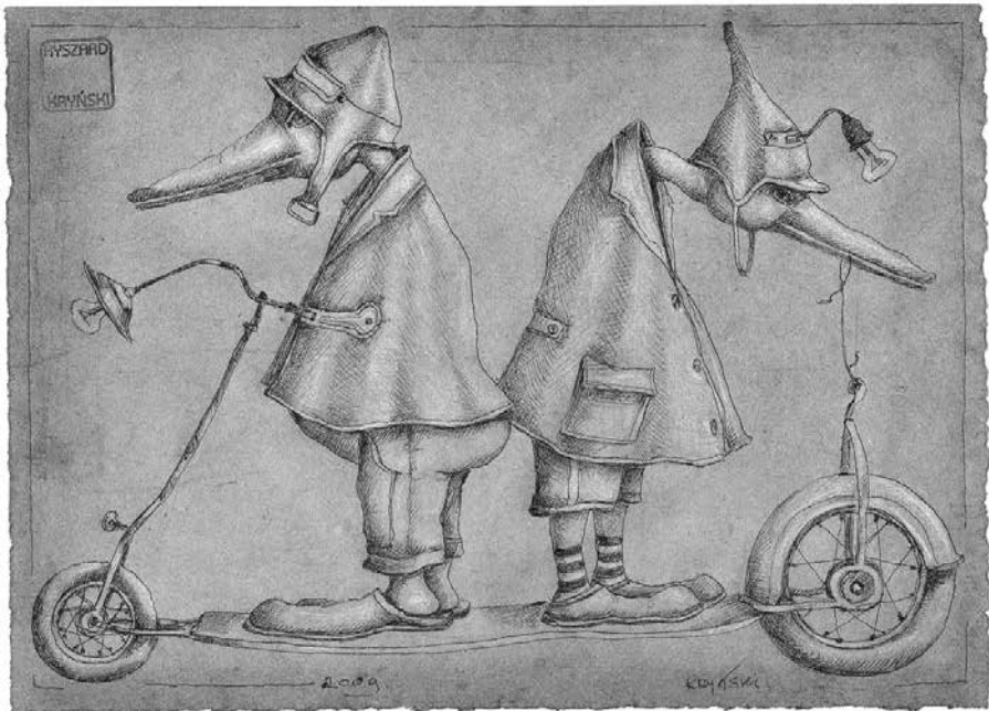
Ryszard Kryński „W którą stronę?”