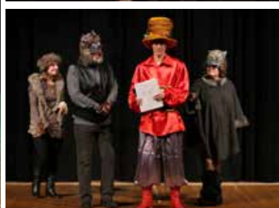
JĄŚ I MAŁGOSIA - spektakl RADOSNEJ RODZINNEJ AKADEMII TEATRALNEJ fot. P. Matelowski